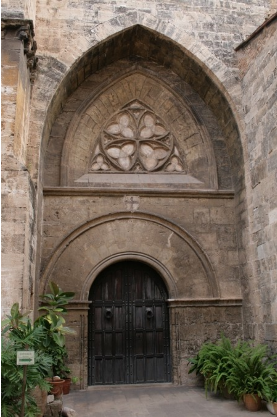
Iglesia San Juan del Hospital de Valencia, puerta románica

En San Juan puede adivinarse las sucesivas etapas de ampliación, reforma y restauración. El gótico en su esplendor está en las dos capillas laterales del presbiterio y en la del testero. Gótico de transición puede verse en las capillas posteriores y en el antiguo claustro hoy testero. En el barroco se recubren los sillares de piedra y la desnudez de los muros de la bóveda con falsas esculpturas, lunetos, relieves, esgrafiados y policromías. De esta época destaca la obra en 1664 del arquitecto Juan B. Pérez, la Real Capilla de Santa Bárbara, famoso por sus esgrafiados. La emperatriz griega Doña Constanza de Hohenstaufen, murió en Valencia en 1307 y quiso ser enterrada en esta iglesia, de ahí que se construyera la capilla citada en honor a Santa Bárbara a quien tenía gran